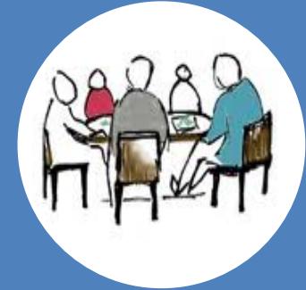
Gemensam kunskapsuppbyggnad och ömsesidig förståelse